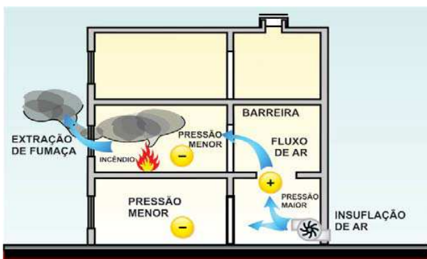
Figura 3: Diferencial de pressão

4.1.3 O controle de fumaça é obtido pela introdução de ar limpo e pela extração de fumaça, pelos seguintes tipos de sistemas, conforme Tabela 1.