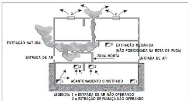
Figura 2: Zonas mortas

fumaça da zona sinistrada, e fechamento das aberturas de extração de fumaça das demais áreas adjacentes à zona sinistrada, conduzindo a fumaça para as saídas externas ao edifício (ver Figura 3).