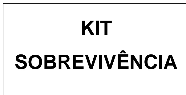
Figura 02 – Identificação do local dos kits na lona.

O local para a disposição dos kits sobre a lona deverá estar identificado na “Lona para Aprestamento”. Padrão: letras e margens na cor preta, e dimensão de 04x08cm.